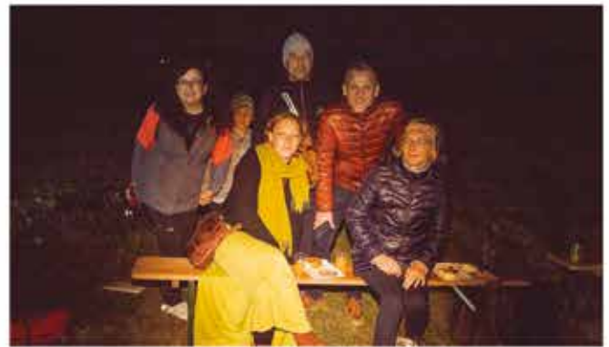
Gute Stimmung bei der Mondscheinwanderung