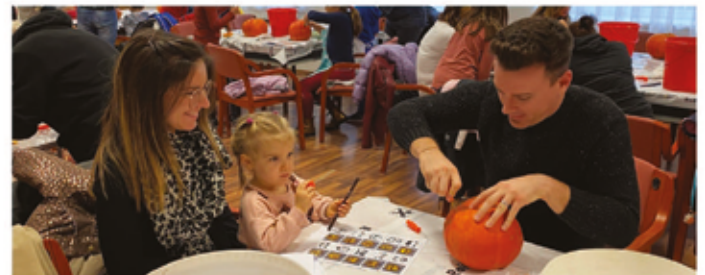
Nicht nur die Kinder, auch die Eltern waren mit Eifer bei der Sache.

stellen, um dem Andrang gerecht zu werden. Die Kinder, aber auch die Eltern und Großeltern hatten einen großen Spaß. Das ist das Wichtigste und das freut uns natürlich sehr!“ Das nächste Fest der Kinderfreunde steht auch schon vor der Tür. Am 3. Dezember ab 16:30 Uhr kommt der Nikolaus ins Kinderfreundeheim. Beim NikolausFEST erwartet die Kinder natürlich ein Überraschungssackerl vom Nikolaus. Um Anmeldung unter wulkaprodersdorf@kinderfreunde.at wird gebeten!