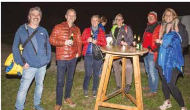
Beim Rückhaltebecken konnten sich die Teilnehmer stärken.