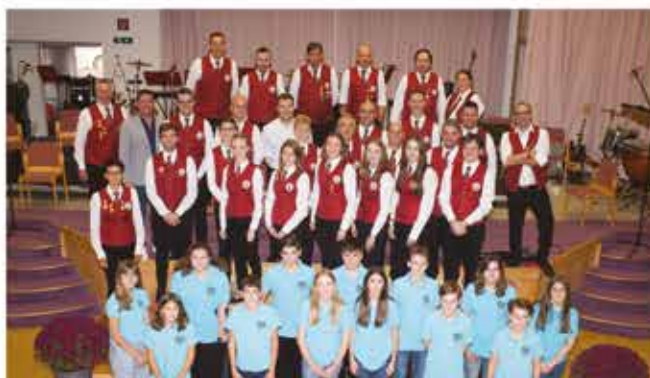
Jugendmusikverein und Jugendorchester MUSICGÄNG