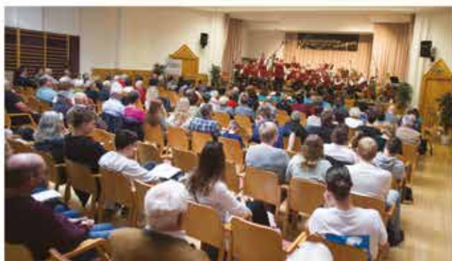
Die Besucher waren von der Darbietung begeistert.

Kontakt: Martin Ivancsits 0650 3147575