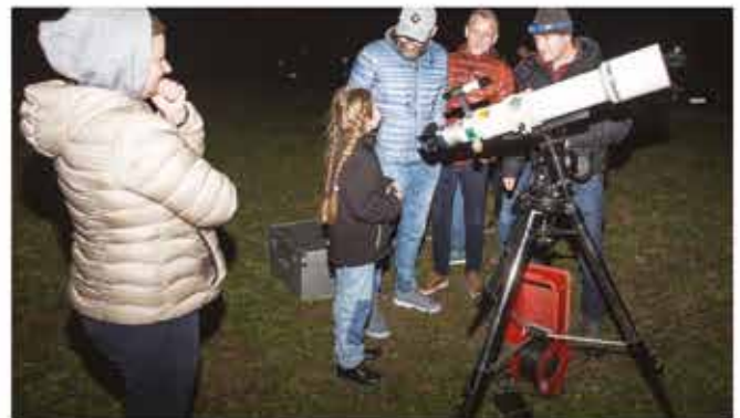
Auch viele Kinder ließen sich das Spektakel nicht entgehen.